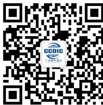
广州国际商会公众号