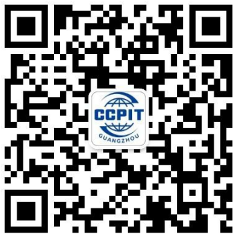
广州市贸促会公众号